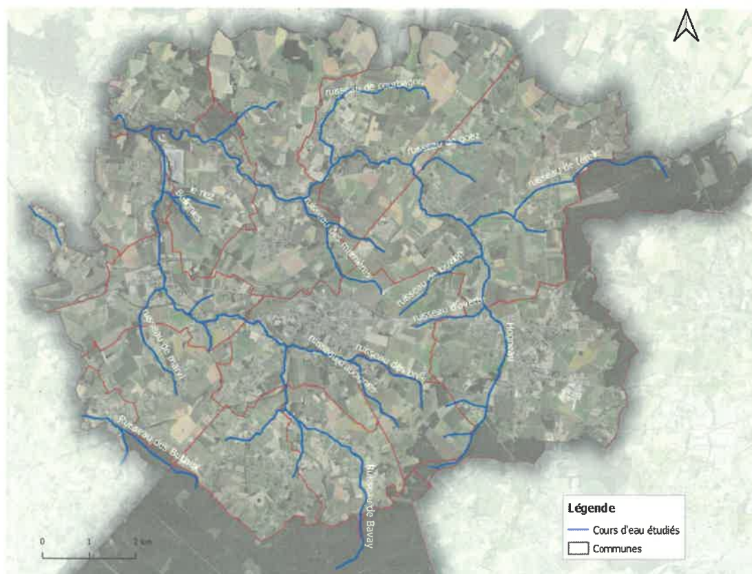
Carte 1 : localisation du réseau hydrographique concerné par le plan de gestion